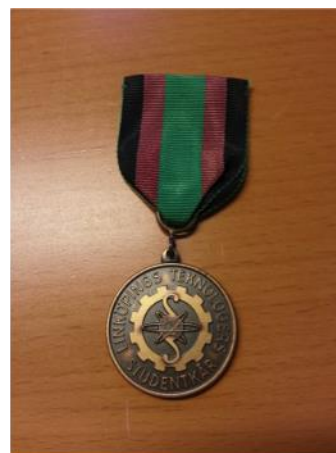
Bild 3. LinTeks bronsmedalj

LinTeks silver-, brons- och förtjänstmedalj kan också utdelas efter särskilt motiverat beslut i kårfullmäktige.