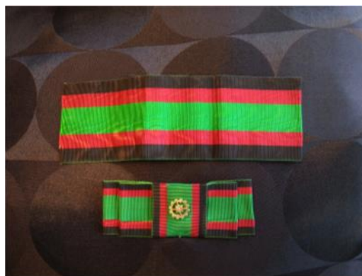
Bild 2. LinTeks kårband

Brett kårband och kårband knutet som rosett kan också berättigas annan engagerad inom LinTek enligt särskilt motiverat beslut i LinTeks kårfullmäktige.